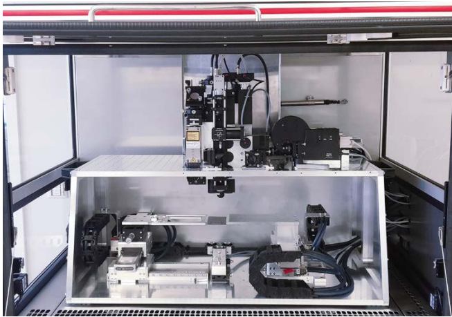
Bild 2: Mit der neuen Raman-LIFTSYS®-Anlage (hier integriert in eine Werkbank) zum kontaktfreien Zelltransport lassen sich verschiedene Systeme für zellbasierte Tests realisieren.

FRAUNHOFER-INSTITUT FÜR LASERTECHNIK ILT FRAUNHOFER-INSTITUT FÜR ANGEWANDTE INFORMATIONSTECHNIK FIT FRAUNHOFER-INSTITUT FÜR GRENZFLÄCHEN- UND BIOVERFAHRENSTECHNIK IGB