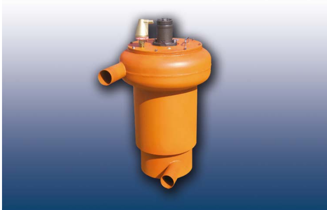
Bild 1: Der SimConDrill-Zyklonfilter soll bis zu 10 µm kleine Partikel effizient aus großen Wassermengen herausfiltern.

PRESSEINFORMATION 29. Januar 2019 || Seite 3 | 4