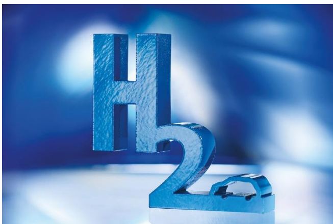
Bild 2: Im neuen Wasserstoff-Labor am Fraunhofer ILT können Besucher des LKH 2 die große Bandbreite an lasertechnischen Versuchsanlagen in Augenschein nehmen.