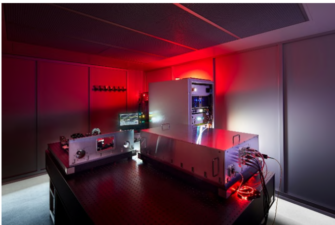
Abb. 1 Der Quantenfrequenzkonverter vom Fraunhofer ILT erlaubt es, Qubits rausch- und verlustarm zwischen verteilten Quantencomputern über bestehende Telekommunikationsnetze zu übertragen.

Vortragsprogramm in der World of Quantum: Application Panels: Themenübersicht (world-of-photonics.com)