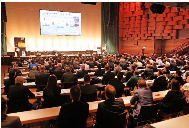
Bild 2: Mehr als 500 Teilnehmende informierten sich auf dem AKL'22 in 87 Vorträgen über Produktionslösungen von morgen.