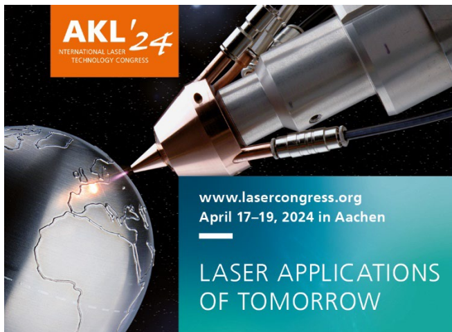
Bild 4: AKL'24 - der umfassende Einblick in die Welt der Lasertechnik an der Schnittstelle von Wirtschaft und Wissenschaft.