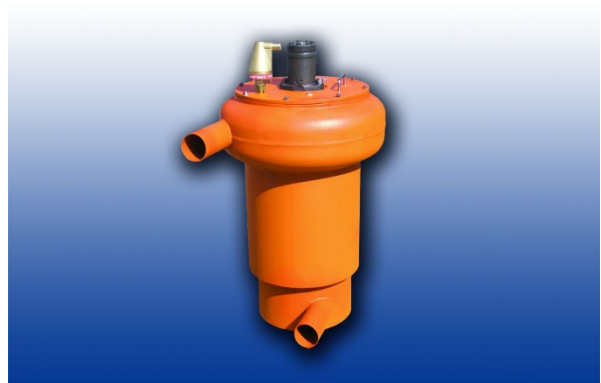
Ein Zyklonfilter mit neu entwickeltem Einsatz soll kleinste Mikroplastikteilchen aus Abwasser abtrennen

Gegensatz zu üblichen Verfahren, kleinere Löcher in Folien zu bohren. Die Anforderungen an die Bohrungen sind hoch: Bei Porendurchmessern unter einem hundertstel Millimeter soll der Durchsatz des Filters den großen Wassermengen im Klärwerk gerecht werden und robust funktionieren. Dies wird über eine möglichst hohe Porosität erreicht: Das heißt ein möglichst großer Teil der Filterfläche soll von Bohrlöchern eingenommen werden.